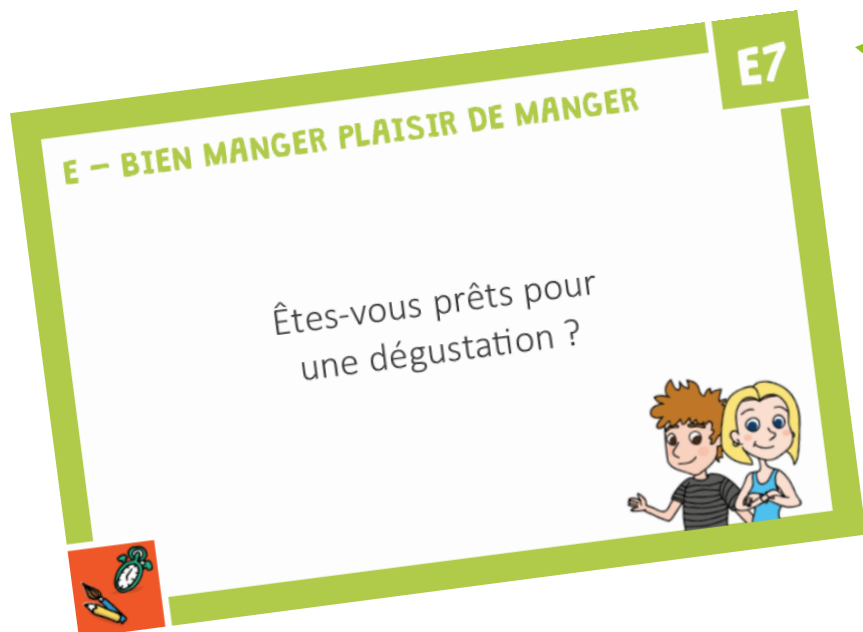
Fiche activité E7

Un mini-parcours « Habitudes alimentaires d'ici et d'ailleurs »